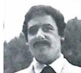
Renato Curcio negli anni '60

Due pagine dattiloscritte, con firma autografa, che Boato ha conservato 53 anni nel proprio archivio. È un inedito, la lettera che gli scrisse Renato Curcio da Milano il 28 agosto 1965 ora pubblicata nel libro, con cui si rivolge all'amico e compagno di studi a Sociologia per dirgli di non considerarsi più un cristiano e chiedergli se